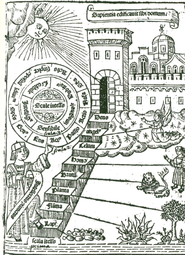
Figure 2 Three scales of intellect connecting earth with the abode of God, from the Liber de ascensu et decensu intellectus of Ramon Llull (written 1304, first published 1512). Organised bodies (unusually including fire) are included in the main scale, depicted as a stairway.