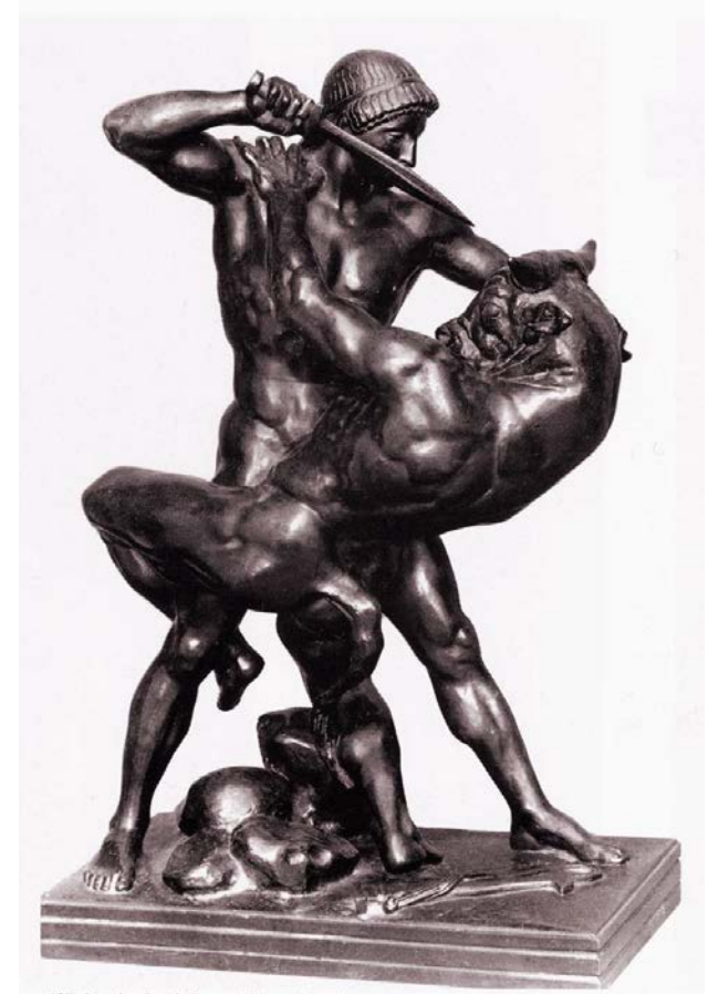
Théséeus zabíjí Minotaura Antoine-Louis Barye, 1840.