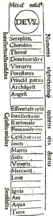
Figure 1 Linear order in nature, from the Physicorum elementorum of Charles de Bouelles (1512). Organised bodies (i.e. minerals, vegetables, animals and man) are not explicitly placed within this chain.